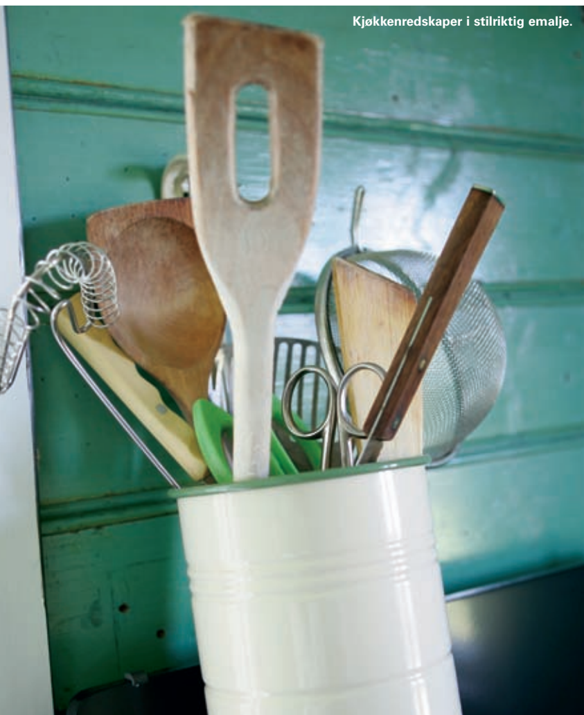
Kjøkkenredskaper i stilriktig emalje.

Det var to kjøkken i huset. Dette er i stor grad beholdt som det var, med noen tilføyelser. Kjøkkenbenken i hjørnet og gasskomfyren er nye. Gulvet er skrapet og malt. Veggene har også fått beholde sitt slitte preg, de er behandlet med kokt linolje. De gamle ledningene er beholdt, men koblet fra. Parafinlampen er ny. Litt av sjarmen er å greie seg mest mulig uten strøm.