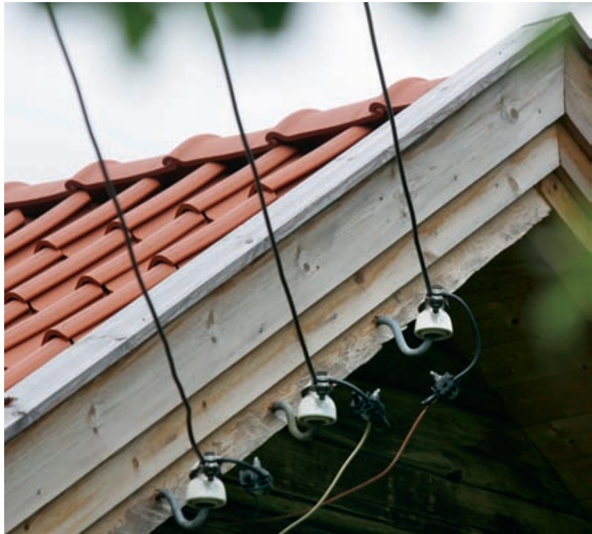
Vindskia oppunder taket utvendig. Det gamle elektriske anlegget med porselensopper er gjenskapt spesielt for huset, takket være en lokal elektriker.

Jeg tror det er viktig for mange mennesker å realisere noe. Å bære på en drøm, og å greie å realisere den. Det er fint. Det er egentlig få drømmer som er så urealistiske at de ikke er verdt et forsøk. Og det er få drømmer som ikke lar seg realisere. ■