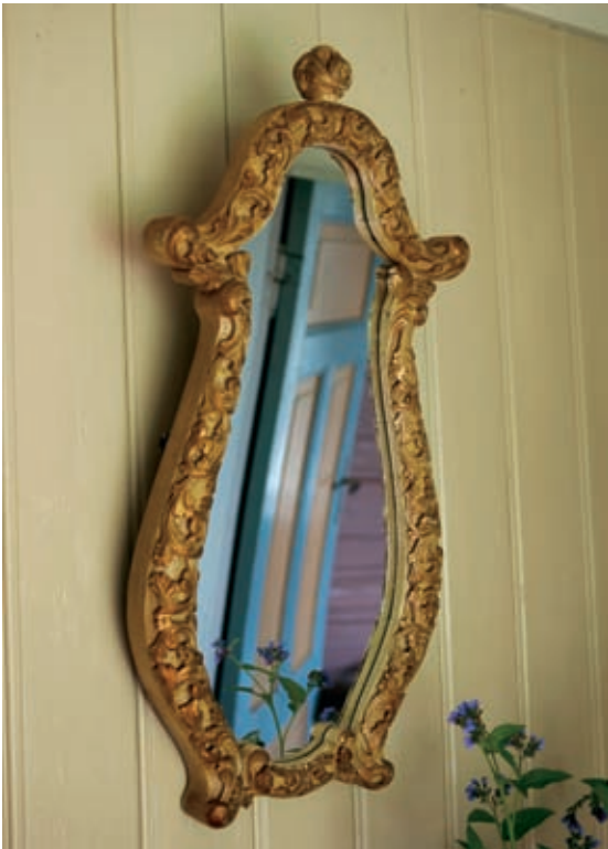
Speil laget av gammelt bogtre og høvre.

gjøre, om de kjenner dragingen. I dag er det mennesker som ringer meg og spør om råd. Det er virkelig hyggelig. Å restaurere et gammelt hus er en egen dille. Dessuten har jeg funnet ut at eiere av gamle hus rett og slett er veldig hyggelige mennesker. Og jeg har ikke gjort noe jeg virkelig angrer på. Nei, det har jeg ikke.