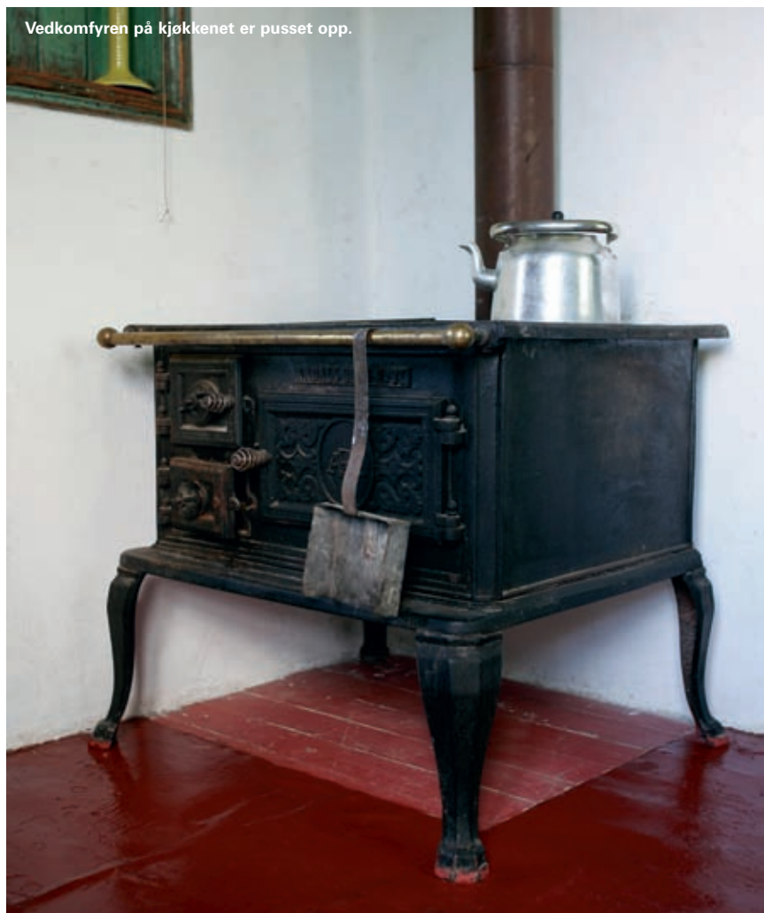
Vedkomfyren på kjøkkenet er pusset opp.